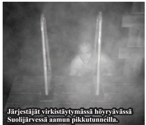
Järjestäjät virkistäytymässä höyryävässä Suolijärven aamun pikkutunneilla.