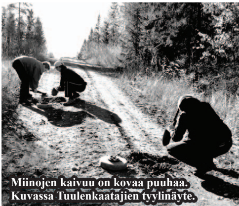
Miinojen kaivuu on kovaa puuhaa. Kuvassa Tuulenskaatäjien tyylinäyte.

don tehtyä. Rastilla siis hurme virtasi, mutta onneksi ei miinojen aiheuttamana.