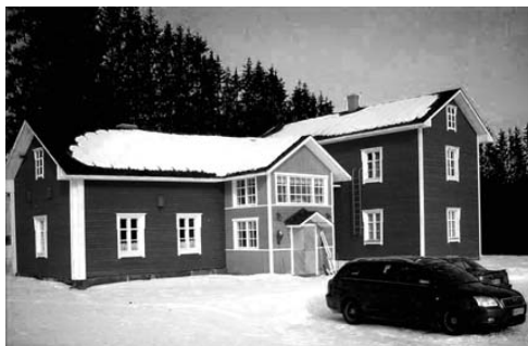
Viikonlopun tukikohtana toiminut mainio maatalo.