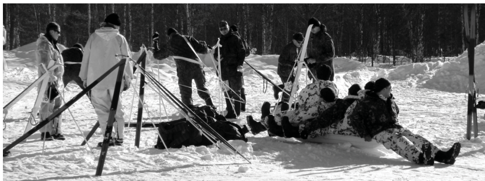
Perjantai meni koulutuksissa; tässä tapauksessa 5 miehen vetämiseen ahkiassa.

Suunnistaminen oli jätetty kokonaan pois, ja joka rastille oli hommattu vesitäydennykset. Saksalaiset, joista osa ei ollut ikinä elämässään hiihtänyt, sanoivat että kilpailu olisi voinut olla rankempi. Näin siis kolme vuotta suunnitellusta armottoman raa’asta kilpailusta saatiin