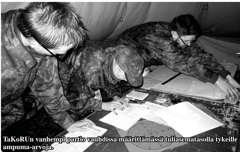
TaKoRU:n vanhempi partio vauhdissa määrittämässä tuliasematasolla tykeille ampuma-arvoja.

Tehtävät arvosteltiin tulosten oikeellisuuden ja niihin käytetyn ajan perusteella. Jokaiselta rastilta oli saatavissa 100 pistettä. Tämän lisäksi suunnistusnopeudesta oli saatavissa enintään 120 pistettä, radan ihanneajan ollessa 2h 8min. Kilpai-