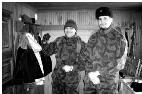
TaKoRUn iskevä nyrkki lähdössä koitokseen voitonvarmoina