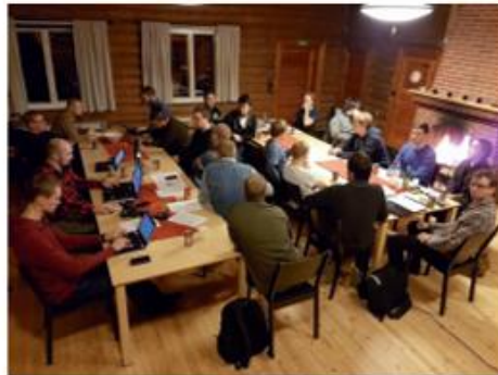
Syyskokous käynnissä Siivikkalan majalla