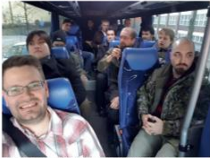
Minibussissa innokkaana matkalla kokoustamaan