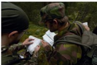
TaKoRU 2 on paikanmääritysrastilla aivan hukassa

Koko kilpailun ajan mukana oli yhteensä 6 joukkuetta. Hauskan lisän kisaan toi hevosilla liikkuva perinnepartio, joka osallistui tapahtumaan vain lauantaina. Kisahan oli TaKoRUN kovissa kilpailuissa keitetuille joukkueille lopulta vain pienimuotoinen edustustehtävä, jonka tavoitteeksi sovittiin jo hyvissä ajoin pojan tuominen kotiin. Niinhän siinä sitten lopulta kävi, että TaKoRU 2 kuittasi itselleen arvostetun kiertopalkinnon ykkösjajalla ja TaKoRU 1 otti komeasti kolmannen sijan. Ensivuonna sitten kaksois- tai kolmoisvoitto on ainoa hyväksyttävä suoritus, jonka kanssa kyseisistä medioista uskaltaa takaisin enää palata.