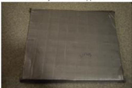
Valmis lasikuituliivi: 2 kerrosta paksu laattarakenne, jonka takana 45 kerrosta laminoitua lasikuitukangasta (300g/m 2 )

Tee-se-itse-intoilijalle rautakauppaluotiliivit ovat siis täyttä todellisuutta.