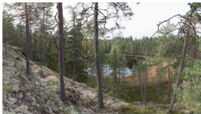
Komea kisa-alueen maisema panoraaman muodossa.

Teksti: Antti Laalahti