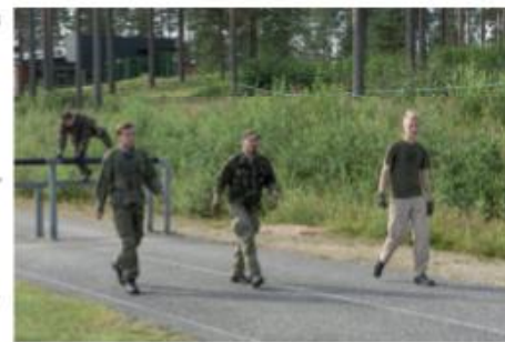
TaKoRU 3 esteradalla

Ilmoittautumisten ja alkupuhuttelun jälkeen itse kisa alkoi perjantai-iltana. Lähtöajat olivat ruuhkautumisen ehkäisemiseksi fiksumusti porrastettu. Meidän partiomme oli lähtöjärjestyksessä viimeinen. Ensimmäinen rasti oli rinkat selässä suoritettava sprinttisuunnistus, joten saimme mukavasti heti alkuun hien pintaan. Partiossamme riitti suunnistustaitoa, joten tämä rasti sujui hyvin. Toinen rasti oli vanha