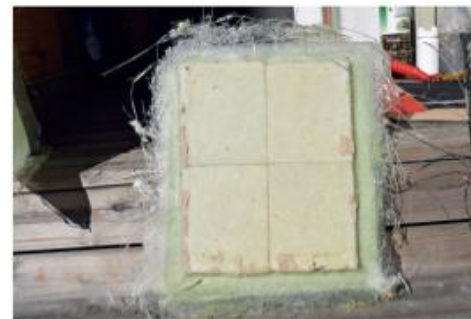
Toisen testin prototyypilasikuituliivi, joka havainnollistaa laattakerrosten sijoittelua ja leikkausta.

Seuraavaksi 12 kerroksen sijaan lasikuitua laminoitiin 45 kerrosta polyesterihartsilla. Laminaatin kuivuttua se leikattiin timanttiliterällä 31x26cm palaksi. Eteen laitettiin kaksi kerrosta laattaa neljäksi erilliseksi osuma-alueeksi. Laatat oli leikattu vanhaan tapaan noin 12,5x15cm kokoisiksi ja niitä upposi kahdeksan liiviin. Koko hökötyksen jesariin ja puoli rullaa myöhemmin oli valmiina. Toinen samanlainen, mutta lasikuitulaminaatin sijaan taakse 7kpl 3mm paksua polykarbonaattia.