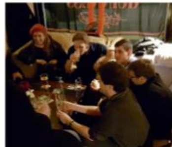
Jatkoilla perinteisesti O'Connell'sissa