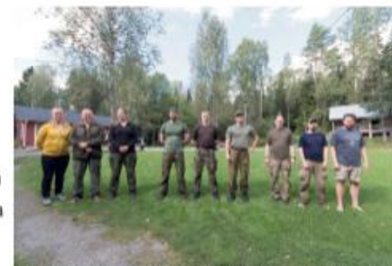
Pönötystä palkintojen jaossa. Vas. tuntematon partio, TaKoRU 2 ja TaKoRU 1.

Itseäni on aina hieman arveluttanut lähteminen näille lyhyemmille yhden yön reissuille, mutta tällä kertaa yllätyin positiivisesti. Kisa järjestettiin Tampereen luonnonkauniissa Teiskossa, Vattulan luonnonsuojelualueella. Kilpailun anti oli varsin hyvä. Rastien teemoina toimivat muun muassa puolijoukkueletta, LV217M, tullilanka, kranaatinheitto, telamiinamatto, ilmakivääri, ensiapu, toiminta miinoitteessa,