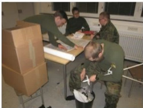
Pirkanmaan joukkue valmistautumassa koitokseen

Keskiviikkoaamusta mahdollisia reittivalintoja sitten lähdettiin tiedustelemaan mahdollisuuksien mukaan autoilla ja hiihtäen, jotta suunniteltu reitti olisi optimi, pystyttäisiin hiihtämään pilkkopimeässä ja jotta vaihtopaikoilla olisi seuraavat hiihtäjät ajoissa ottamaan viestikapulana toimivaa, EMIT-laitteella ja gps paikantimella varustettua, rynnäkkökivääriä selkäänsä. Kokonaismatkaksi tuli noin 80km, jonka kilpailun nopein joukkue, Suur-Savo (B-sarja), suoritti noin 4,5 tunnissa. Kilpailussa oli kaksi sarjaa A ja B, joista A:ssa kilpailivat varusmiesjoukkueet eri joukko-osastoista höystettynä joukkueita johtavilla kapiAISilla ja B:ssä reserviläisjoukkueet aluetoimistojen hallinnoimilta alueilta.