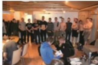
Paljon osallistujia, paljon palkittuja, joiden on helppo hymyillä

Tämän vuoden partiotaitokilpailu oli siinä mielessä merkittävä, että se yhdisti TaKoRU:n perinteisen kilpailun kuin myös ORUP:n vuosittaisen piirinmestaruuskilpailun. Valtakunnallisessa mittakaavassa TaKoRU:n kilpailu on tyylikäs, sotilaallinen ja sopivan vaativa nuorelle reserviläiselle. Tästä syystä oli kunnia asia saada kutsua piirin jäsenyhdistykset tutustumaan, miten hyvä partiotaitokilpailu järjestetään! Tämän toivottiin saavan piirin jäsenyhdistyksissä kipinää vastaavia jotoksia kohtaan, tai vielä mieluummin ajatusta ydinporukan keräämisestä, joka voisi tulevaisuudessa jotoksen paikallisesti järjestää.