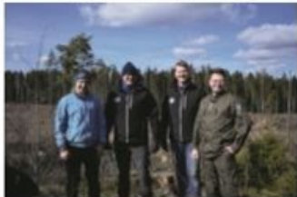
Kilpailua olivat seuramassa niin RUL:n, ORUPin kuin LaTeRes:nkin pj:t