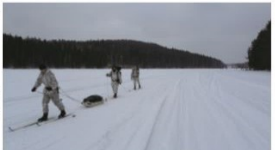
TaKoRU:n partion sukset luistavat ahkionkin kanssa

mikä aiheutti useille partioille haasteita, ja monet partiot jäivätkin suunnistuksessa maksimajan ylittyttyä kokonaan ilman pisteitä. Varsin hyvin sujunut suunnistus ei kuitenkaan riittänyt aivan kahden kärkijoukkueen vauhtiin, ja pikataipaleena toteutettu suunnistus oli lopulta ammunnan lisäksi ainut rasti, jolla jäimme kilpailun voittaneen Pirkanmaa 1:n taakse.