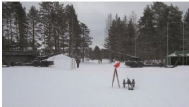
Perinteikkäällä kilpailulla oli arvoisensa maali

Ensimmäistä kertaa mukana ollut Pirkanmaa sijoittui B-sarjassa sijalle 8/10, mutta puolustukseksi on sanottava, että monella muulla joukkueella oli riveissään entisiä ammattilaisurheilijoita ja useiden vuosien kokemus kilpailusta. Ensi vuonna saavat muut varoa, sillä nyt myös Pirkanmaalla tiedetään mistä ihmeestä tässä on kysymys.